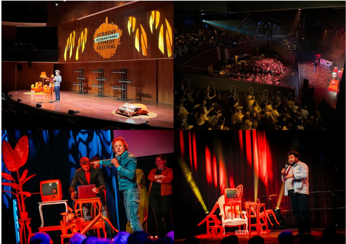
De Big Binge of Comedy 2024: