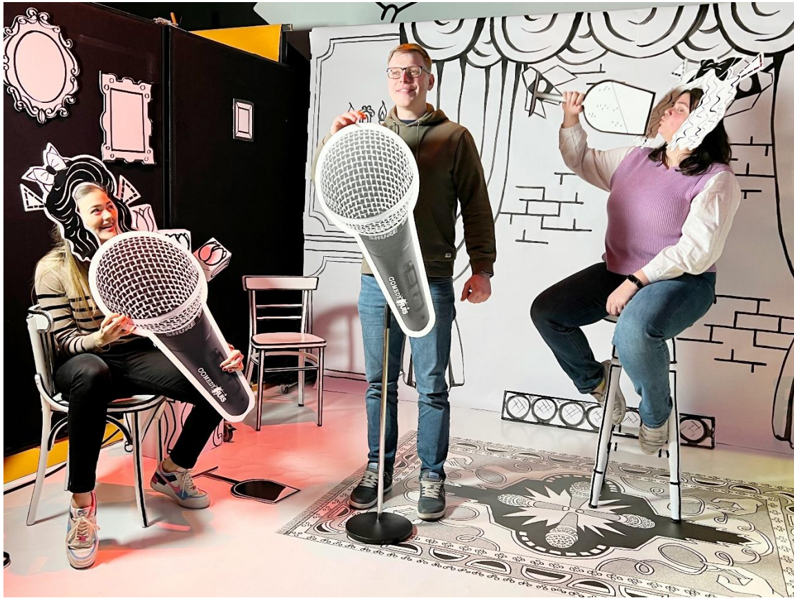
Foto's maken op de Comedy Playground.